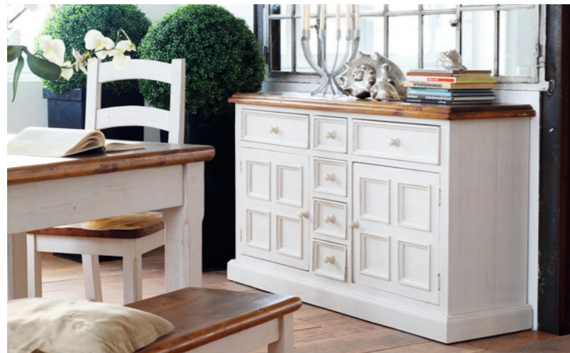
FH302003 Sideboard 2trg. / 6 Schubkästen