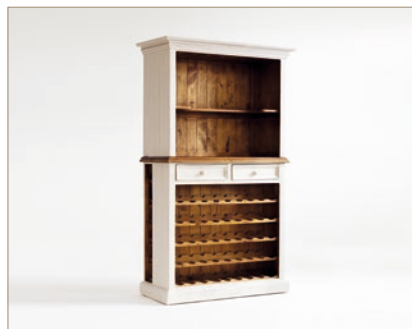
FH302014 Buffet mit Weineinsatz 2 Schubkästen / 2 offene Fächer B/H/T ca. 112/190/52 cm