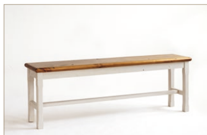
FH302040 Bank B/H/T ca. 153/52/35 cm