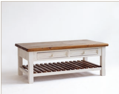
FH302055 Couchtisch 2 Schubkästen / 1 Ablagefach B/H/T ca. 140/55/80 cm (Beine ca. 10x10 cm)