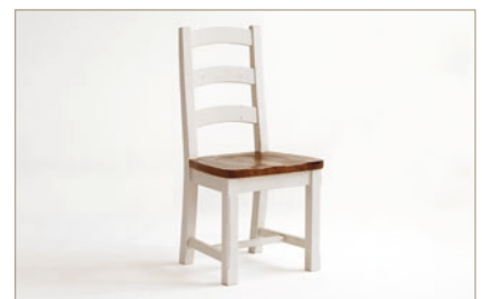
FH302045 Stuhl, ungepolstert B/H/T ca. 48/108/51 cm • VPE: 2