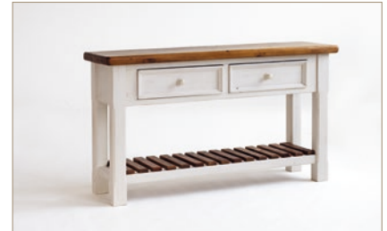
FH302001 Anrichte 2 Schubkästen B/H/T ca. 130/75/40 cm