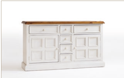
FH302003 Sideboard 2-trg. / 6 SK B/H/T ca. 160/90/45 cm

Durch diese unterschiedlichen natur- sowie verwendungsbedingten Merkmale der Hölzer entsteht die einzigartige Oberfläche, die jedes Möbel aus dem Programm „BODDE“ zu einem unverwechselbaren Unikat macht.