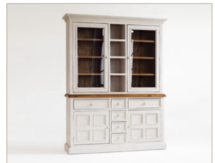
FH302013 Buffet 2 Türen / 2 Türen mit Glas / 6 Schubkästen / 4 offene Fächer B/H/T ca. 166/215/45 cm