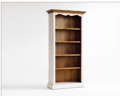
FH302007 Regal 5 offene Fächer B/H/T ca. 92/183/36 cm