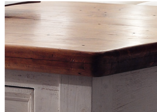
FH302055 Couchtisch FH302007 Regal FH302060 TV-Element FH302030 Kommode mit Rattankörben