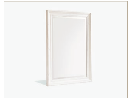
FH302020 Spiegel B/H/T ca. 106/150/9 cm