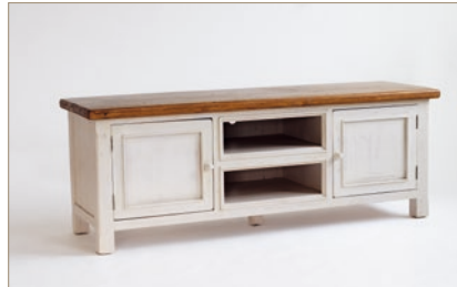
FH302060 TV-Element 2-trg. / 2 offene Fächer B/H/T ca. 178/65/54 cm