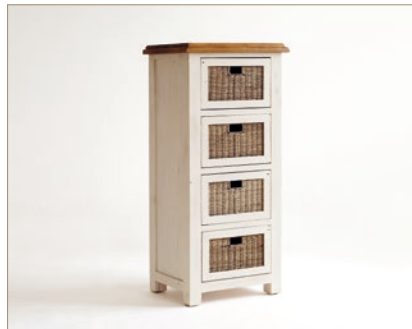
FH302030 Kommode mit 4 Rattankörben B/H/T ca. 45/127/58 cm