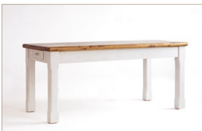
FH302050 Tisch mit 2 Schubladen B/H/T ca. 180/80/90 cm